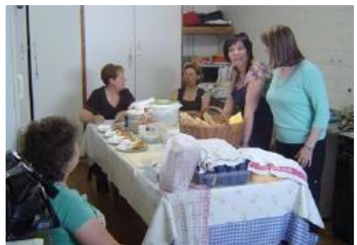
De dames aan het werk.