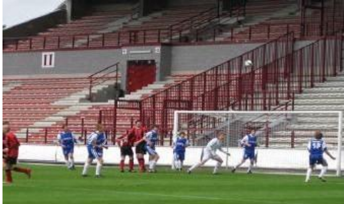
Soleo in actie tijdens finale Beker Leenen