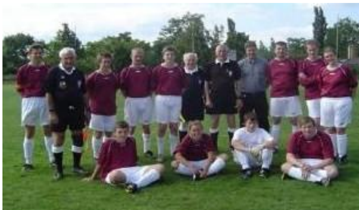
Soleo op het Pinkstertornooi.